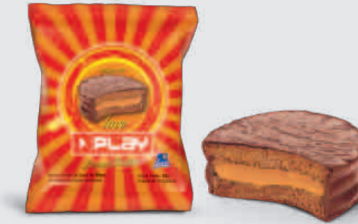
ALFAJOR PLAY LOVE