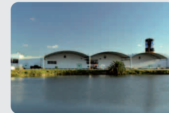
Planta en Uruguay