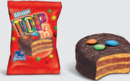
ALFAJOR TOP TRIPLE MOUSSE