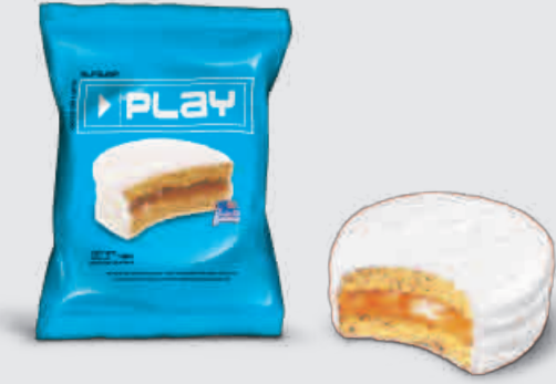
ALFAJOR PLAY NIEVE