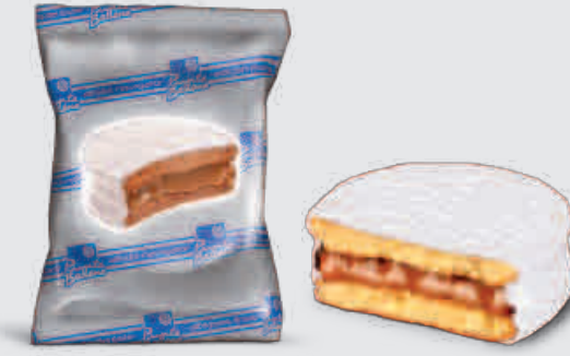
ALFAJOR NAVIGATOR NIEVE