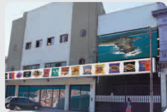
Planta en Argentina